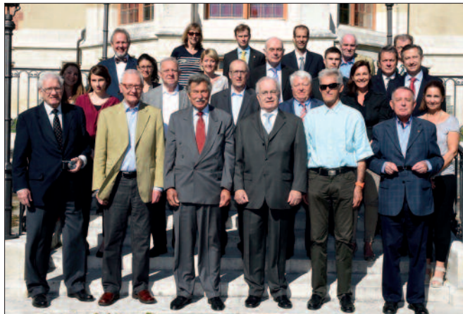
Teilnehmer der Jahrestagung der Rechtsschutzbeauftragten.