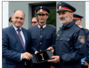
PI Gattendorf: Innenminister Wolfgang bei der symbolischen Schlüsselübergabe.

Dienst. Sie sind für ein 202 Quadratkilometer großes Überwachungsgebiet zuständig. „Moderne Dienststellen sorgen nicht nur für einen Motivationsschub für unsere Polizistinnen und Polizisten, sondern stärken das Sicherheitsgefühl aller Bürgerinnen und Bürger“, sagte Sobotka bei der Eröffnung.